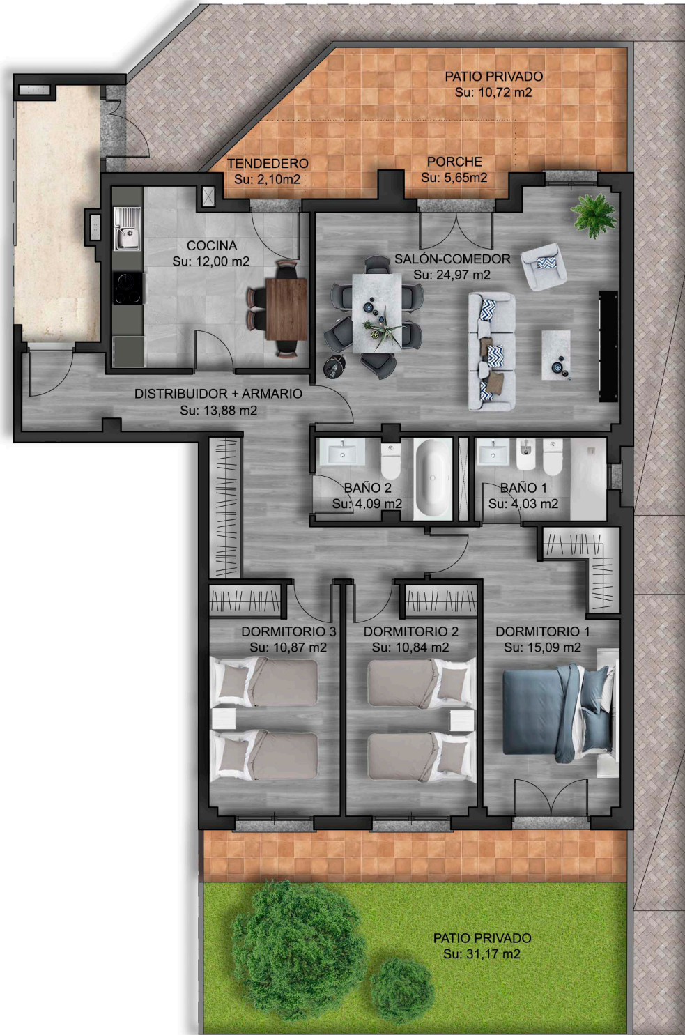
IMÁGENES DE CARÁCTER NO CONTRACTUAL