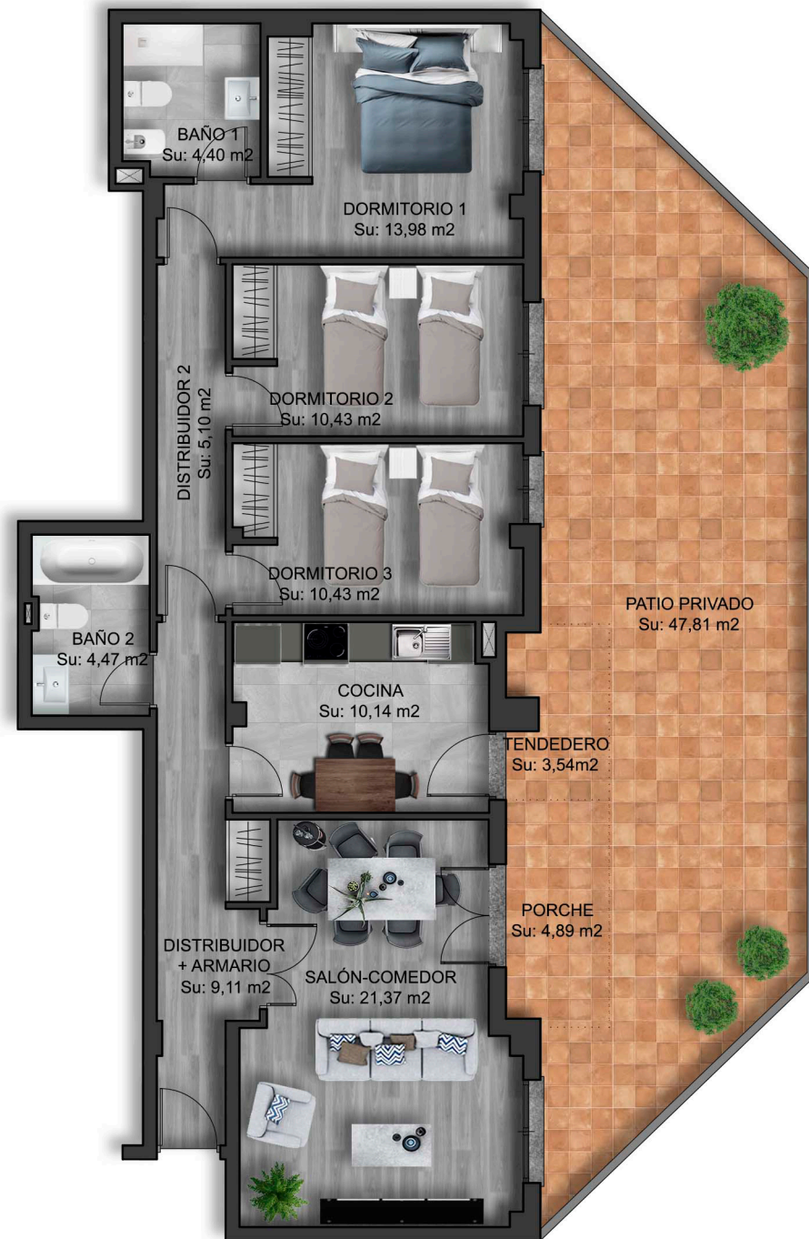
IMÁGENES DE CARÁCTER NO CONTRACTUAL