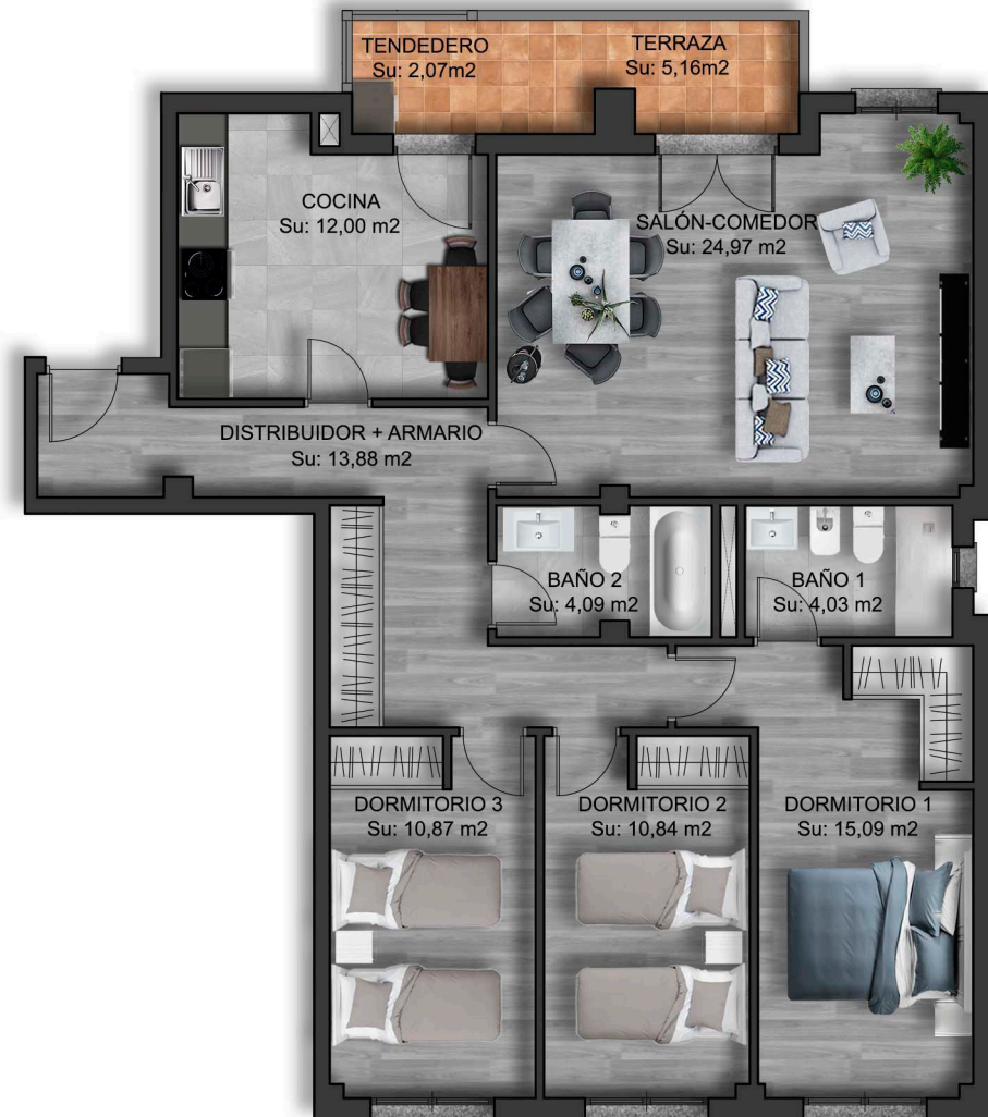
IMÁGENES DE CARÁCTER NO CONTRACTUAL