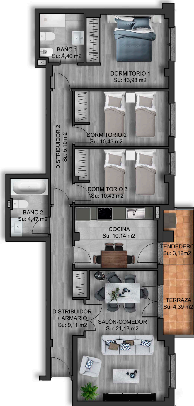
IMÁGENES DE CARÁCTER NO CONTRACTUAL