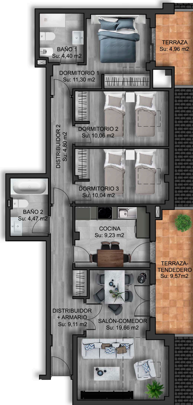
IMÁGENES DE CARÁCTER NO CONTRACTUAL