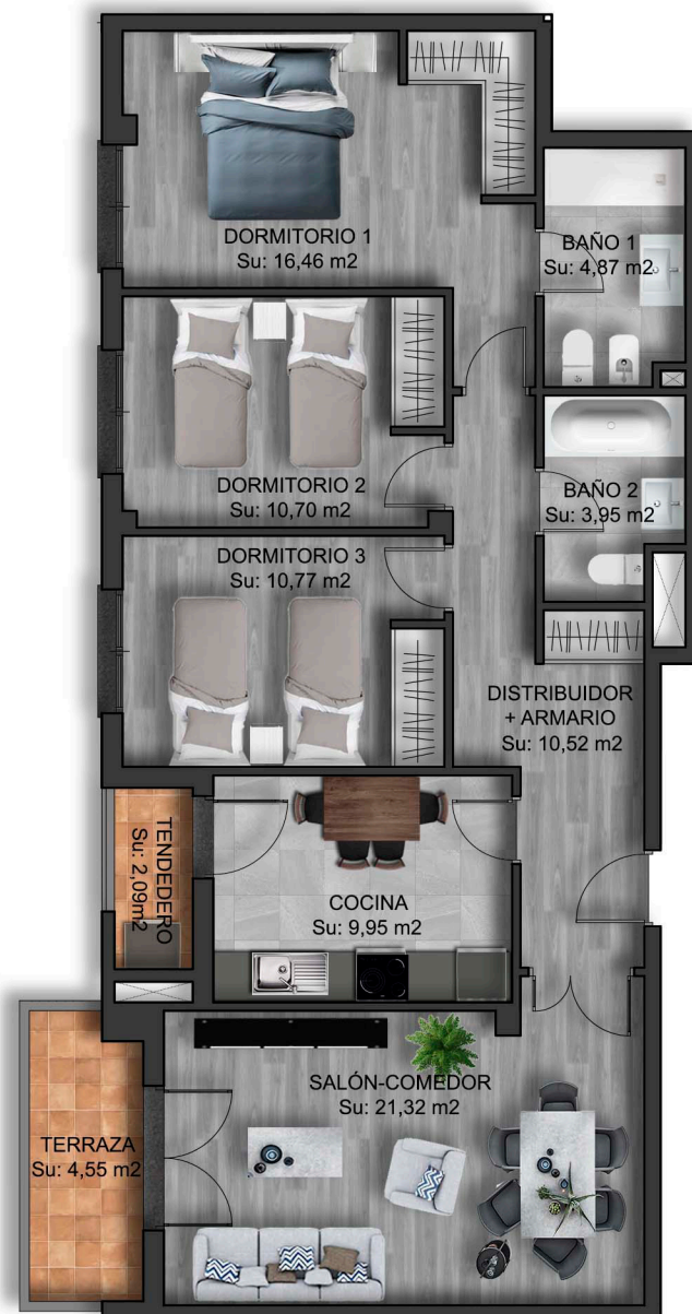
IMÁGENES DE CARÁCTER NO CONTRACTUAL