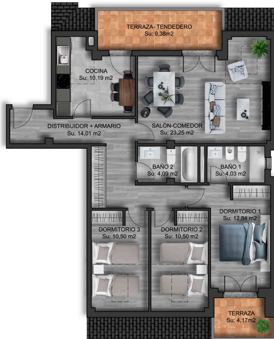
IMÁGENES DE CARÁCTER NO CONTRACTUAL