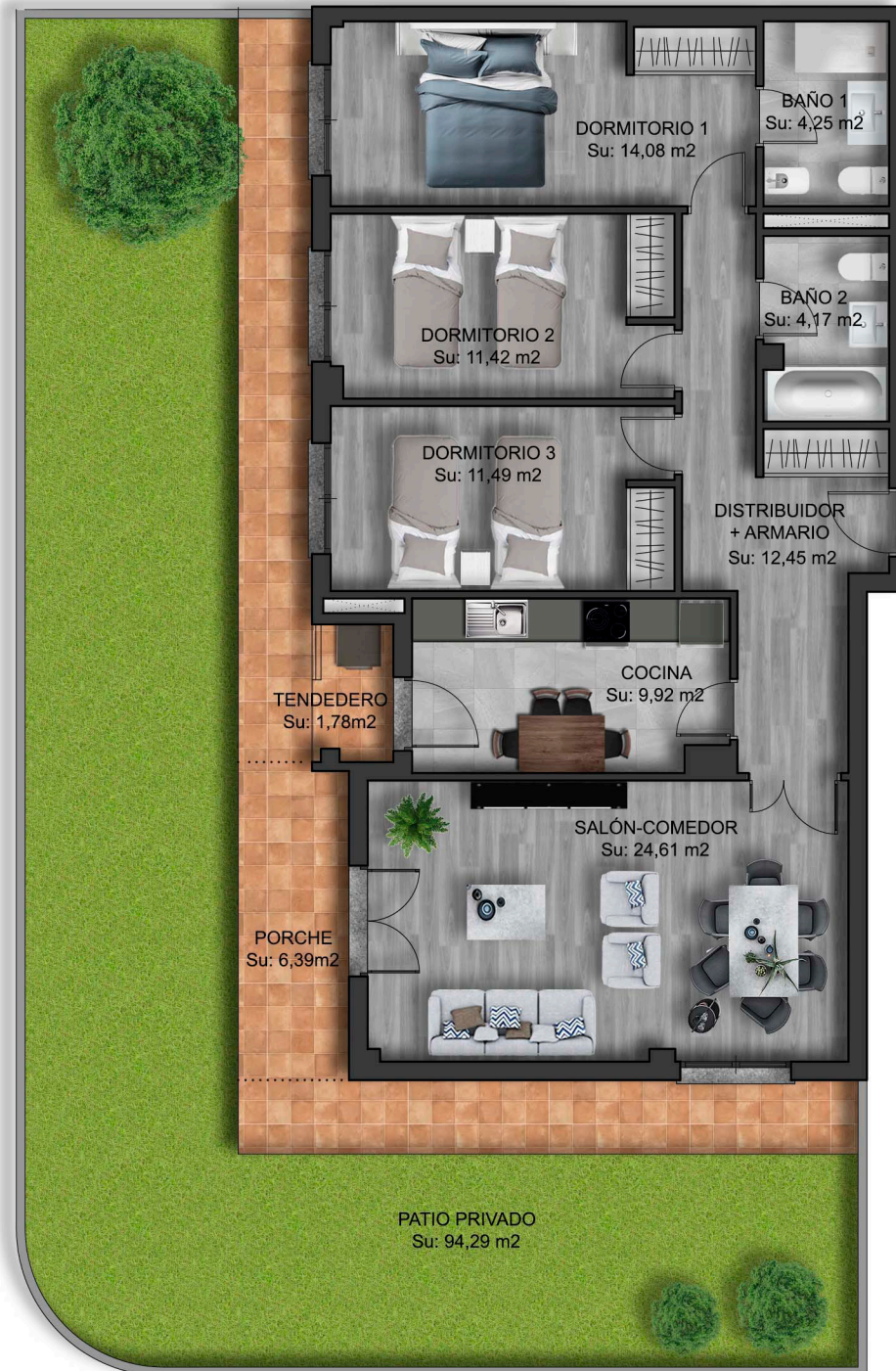
IMÁGENES DE CARÁCTER NO CONTRACTUAL