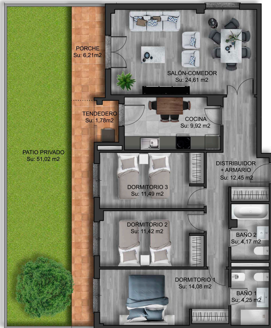
IMÁGENES DE CARÁCTER NO CONTRACTUAL