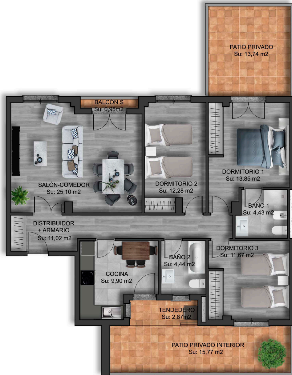
IMÁGENES DE CARÁCTER NO CONTRACTUAL