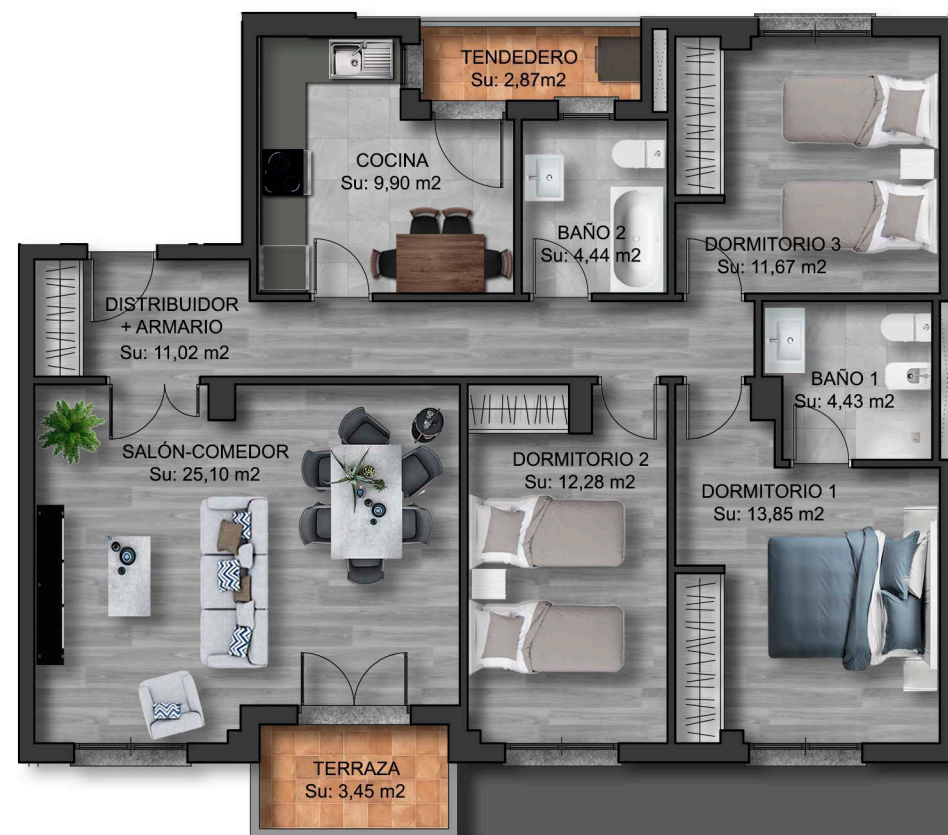
IMÁGENES DE CARÁCTER NO CONTRACTUAL