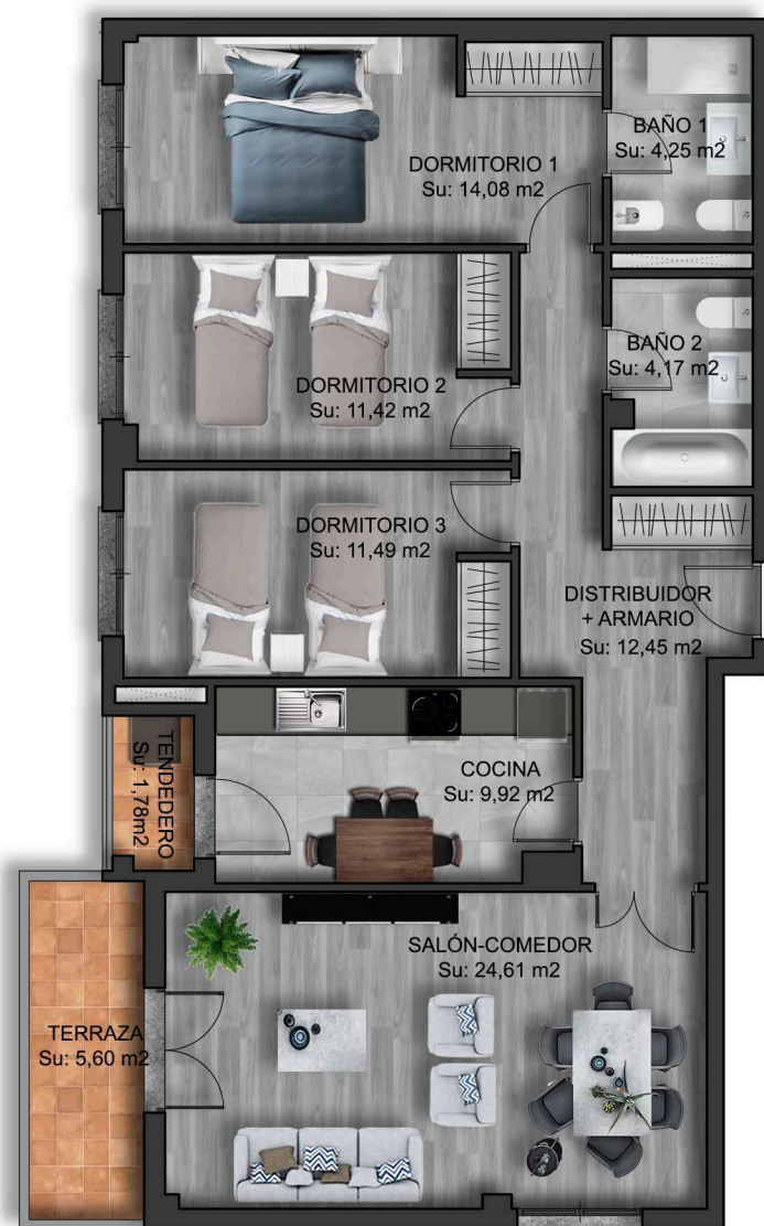
IMÁGENES DE CARÁCTER NO CONTRACTUAL