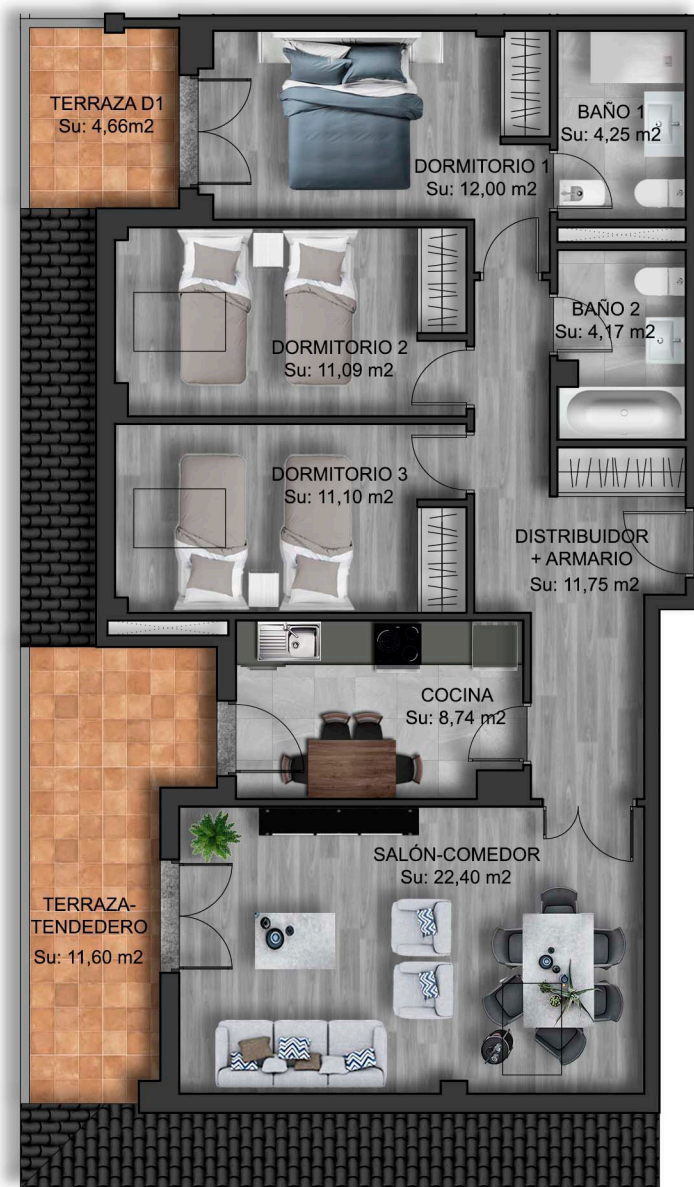
IMÁGENES DE CARÁCTER NO CONTRACTUAL