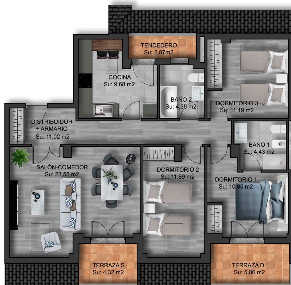
IMÁGENES DE CARÁCTER NO CONTRACTUAL