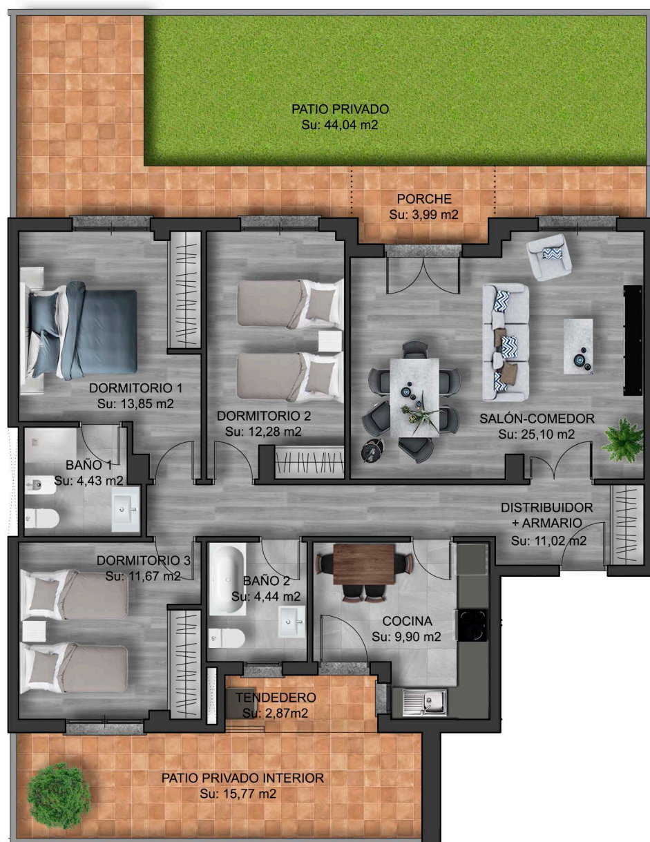
IMÁGENES DE CARÁCTER NO CONTRACTUAL