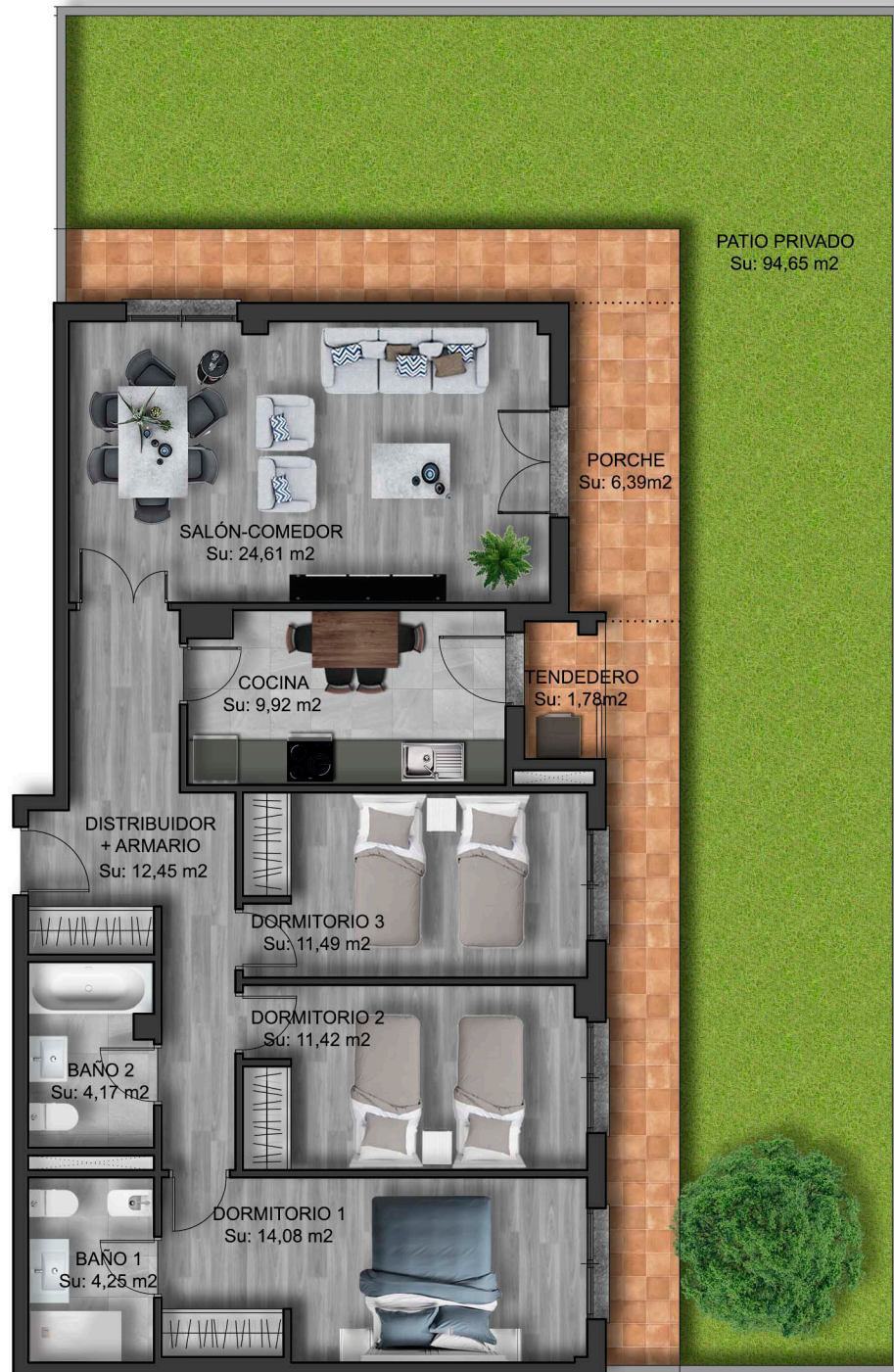
IMÁGENES DE CARÁCTER NO CONTRACTUAL