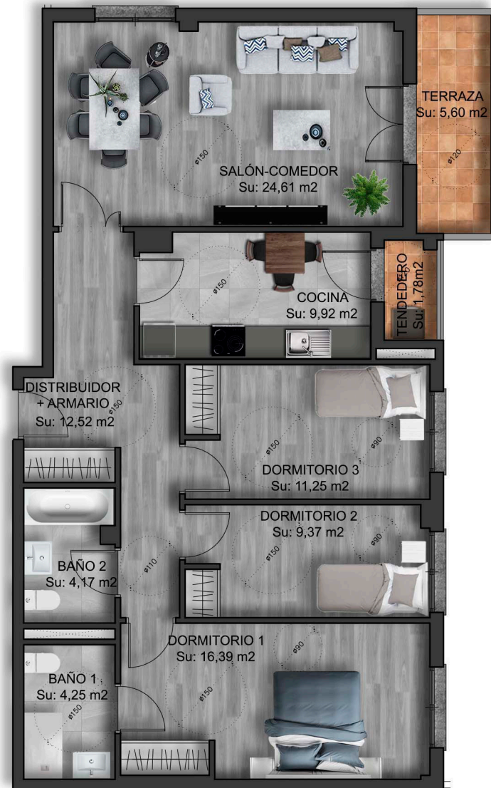
IMÁGENES DE CARÁCTER NO CONTRACTUAL