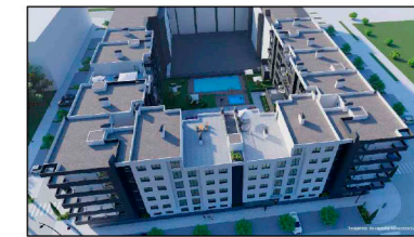
PARCELA C5.2 PP02, "LOS MOLINOS" GETAFE -MADRID-

*INCLUYE 21,64 M 2 DE PATIO DESCUBIERTO (NO REFLEJADO EN TABLA)