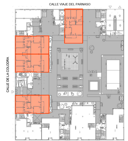
AVDA. DEL INGENIOSO HIDALGO