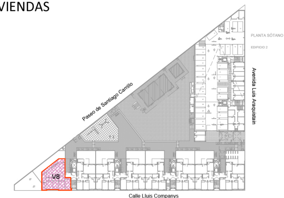
ESQUEMAS DE VIVIENDAS POR PLANTAS PLANTA BAJA (EDIFICIO 1) PLANTA SÓTANO 2 (EDIFICIO 2) "BUENAVISTA", GETAFE -MADRID-