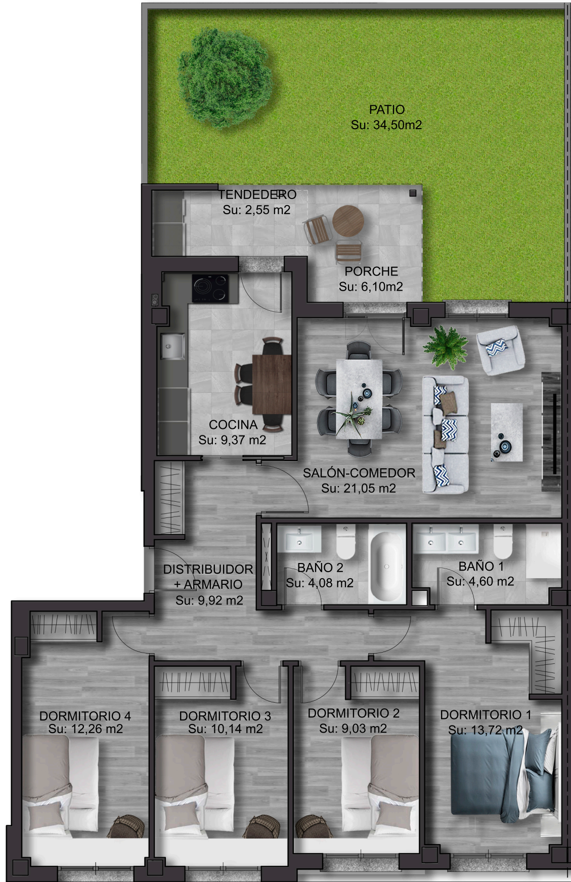
IMÁGENES DE CARÁCTER NO CONTRACTUAL VIVIENDA TIPO UBICADA EN PORTAL 2 (PLANTA BAJA) ESCALA 1/75