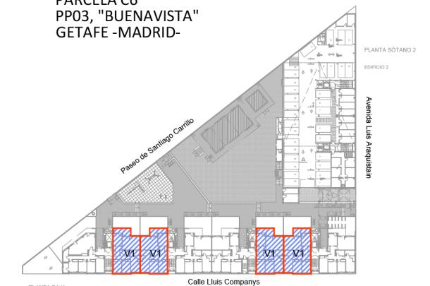
ESQUEMAS DE VIVIENDAS POR PLANTAS PLANTA BAJA (EDIFICIO 1) PLANTA SÓTANO 2 (EDIFICIO 2) "BUENAVISTA", GETAFE -MADRID-