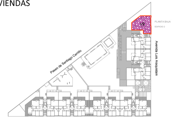
ESQUEMAS DE VIVIENDAS POR PLANTA PLANTA PRIMERA (EDIFICIO 1) PLANTA BAJA (EDIFICIO 2) "BUENAVISTA", GETAFE -MADRID-