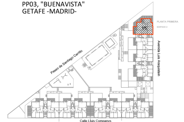
ESQUEMAS DE VIVIENDAS POR PLANTA PLANTA SEGUNDA (EDIFICIO 1) PLANTA PRIMERA (EDIFICIO 2) "BUENAVISTA", GETAFE -MADRID-