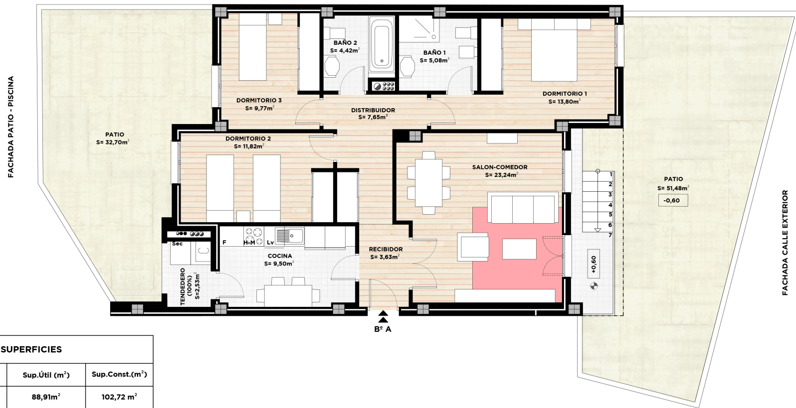
TABLA DE SUPERFICIES