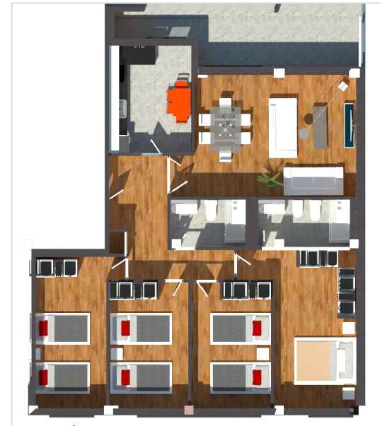
IMÁGENES DE CARÁCTER NO CONTRACTUAL