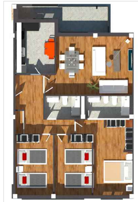
IMÁGENES DE CARÁCTER NO CONTRACTUAL