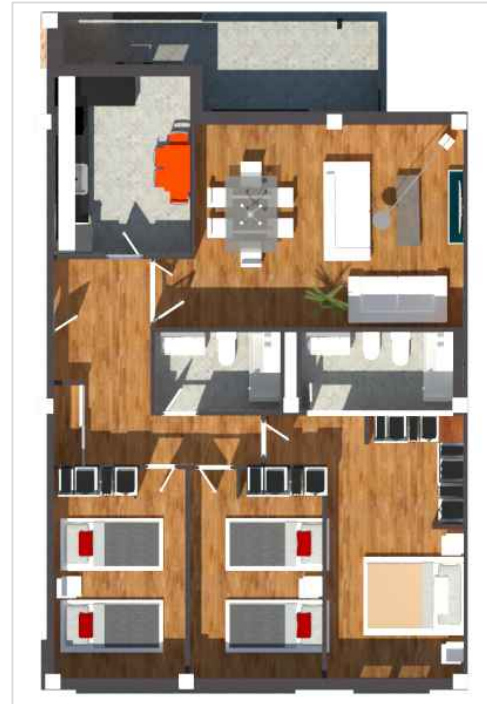
IMÁGENES DE CARÁCTER NO CONTRACTUAL