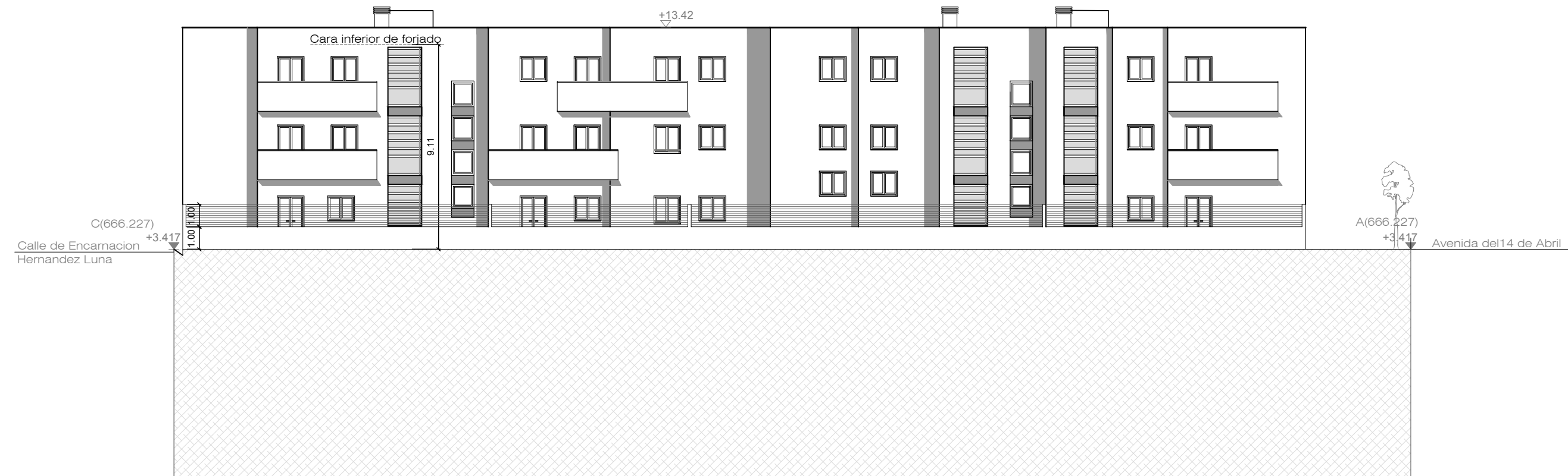
ALZADO AVENIDA MILICIAS REPUBLICANAS E: 1/200