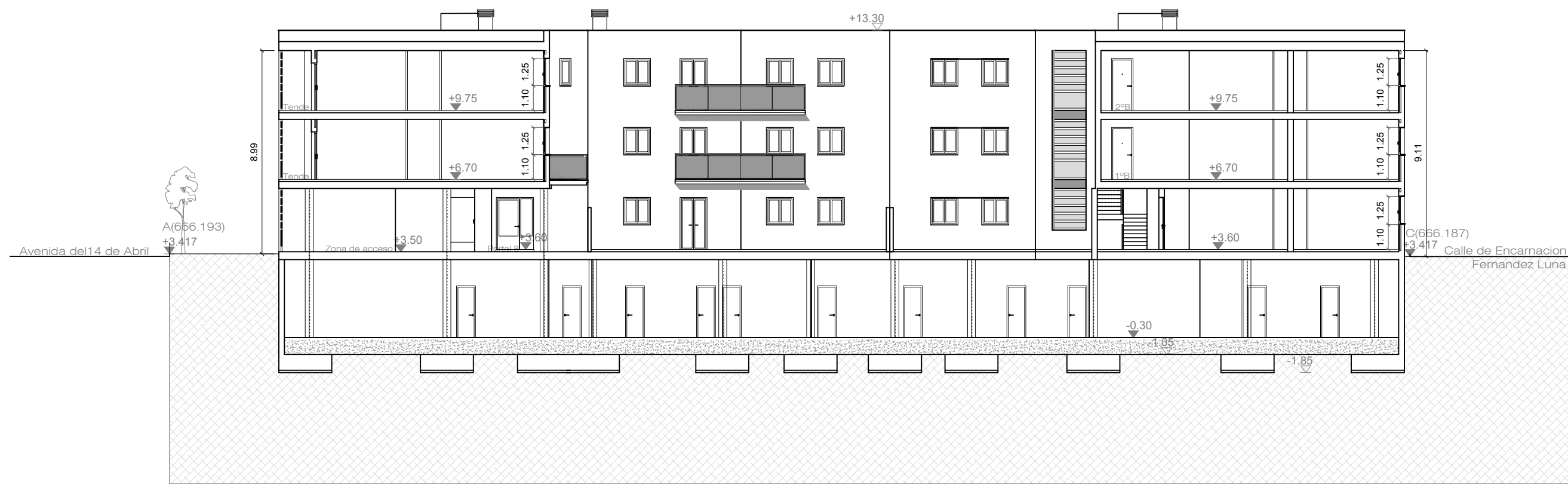
SECCION D-D (INTERIOR) AVENIDA MILICIAS REPUBLICANAS E: 1/200